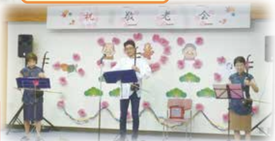
二胡アンサンブル ブラン・ルナの皆様、 素敵な演奏、ありがとうございました。