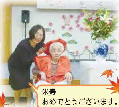
米寿 おめでとうございます。