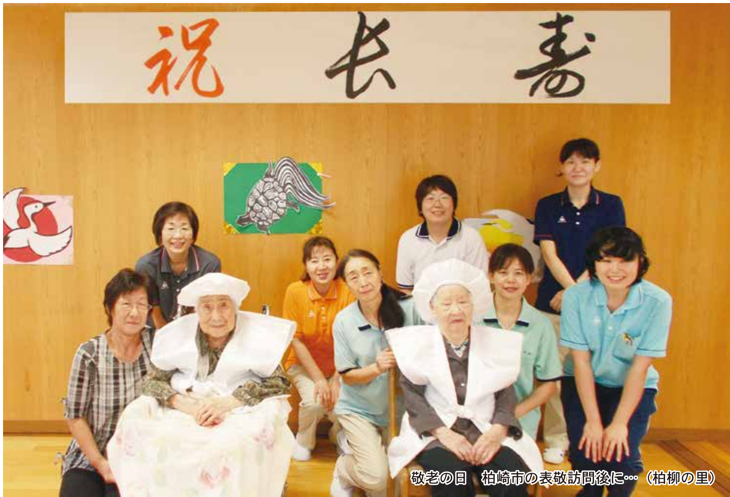
敬老の日 柏崎市の表敬訪問後に... (柏柳の里)