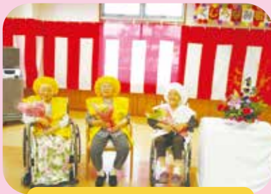
おめでとうございます。