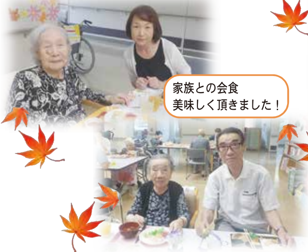
家族との会食 美味しく頂きました！