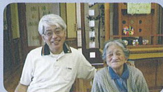
「めずらしい舞を見て、良かった」との声をたくさんいただきました。