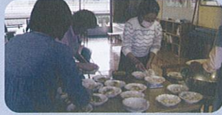
ご家族と一緒に、ちらし寿司を作りました。「とってもおいしかった。」と喜んでられました。