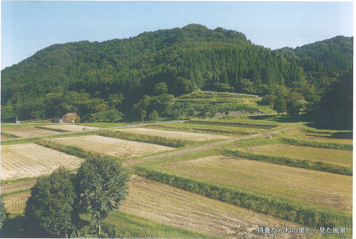
特養たんねの里から見た風景