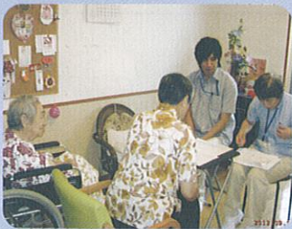
入居者・ご家族へ、ケアプラン説明を行い、同意を得てサービスを行っています。その他、担当職員も入り、生活の様子もお伝えしました。