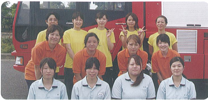
上段より、くじらなみチーム、柏柳の里チーム、いこいの里チーム

この日に向けて各施設練習に取り組み、当日は猛暑の中、その成果とチームワークが発揮され、くじらなみが三位入賞しました。