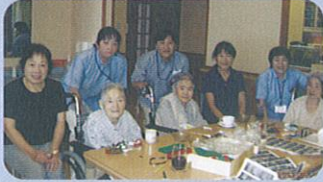
親子での共同作業！終わった後の表情は達成感に満ちていました。