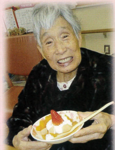
3月の行事の様子(柏柳の里)