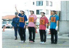
整列し競技スタート