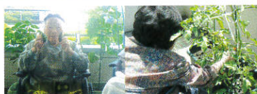
野菜作りもしました。

7月25日、鯨波地区コミセンの皆様による「山車・みこし」が町内周りに来てくださいました。 7月30日、施設では夏祭りを行いました。今年も気温同様、暑い夏になりました。