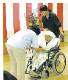
施設より記念品の贈呈

9月15日の敬老の日、100歳表敬訪問として、県・市より記念品の贈呈がありました。4名の方が表彰を受けました。