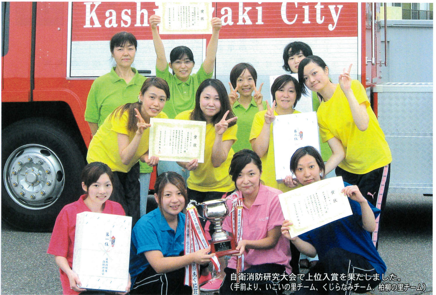
自衛消防研究大会で上位入賞を果たしました。 (手前より、いこいの里チーム、くじらなみチーム、柏柳の里チーム)