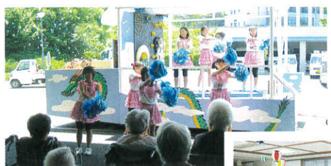
かわいらしい！楽しませていただきました。