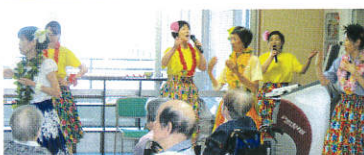
職員による歌謡ショー