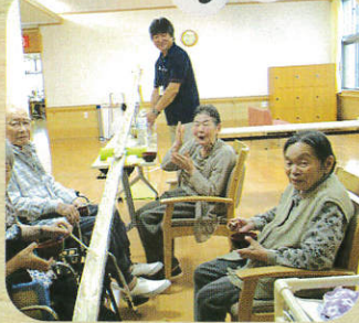
園長がそうめんを流すところを撮影しました。皆さん、まだか、まだか、と待っています。