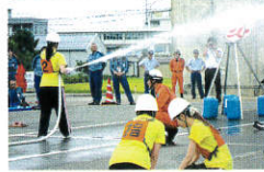
火点方向へ放水と救助