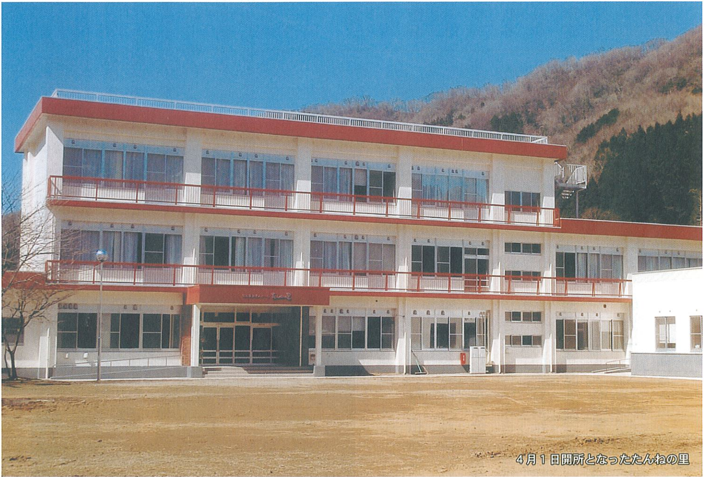
4月1日開所となったたんねの里