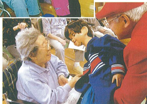
くじらなみ 鯨波コミセン福祉部の皆様