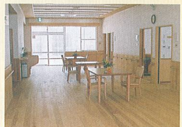
1階 食堂・リビング