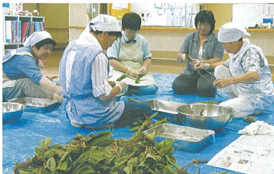
柏柳の里 地域の方々といっしょに笹団子作り