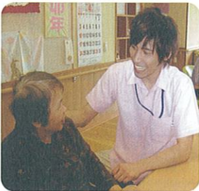
入居者・利用者の声を第一に受けとめ、あなたらしい生活を大切にしていきます。

今年度も、大勢の職員が参加できるような内容を計画し、「あなたらしい生活を大切に」するため、より質の高いサービスが提供できるようにしたいと思います。