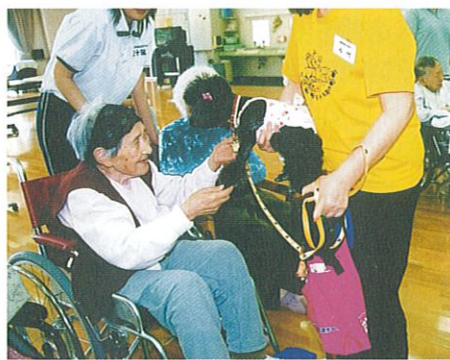
いこいの里 動物ふれあい 訪問