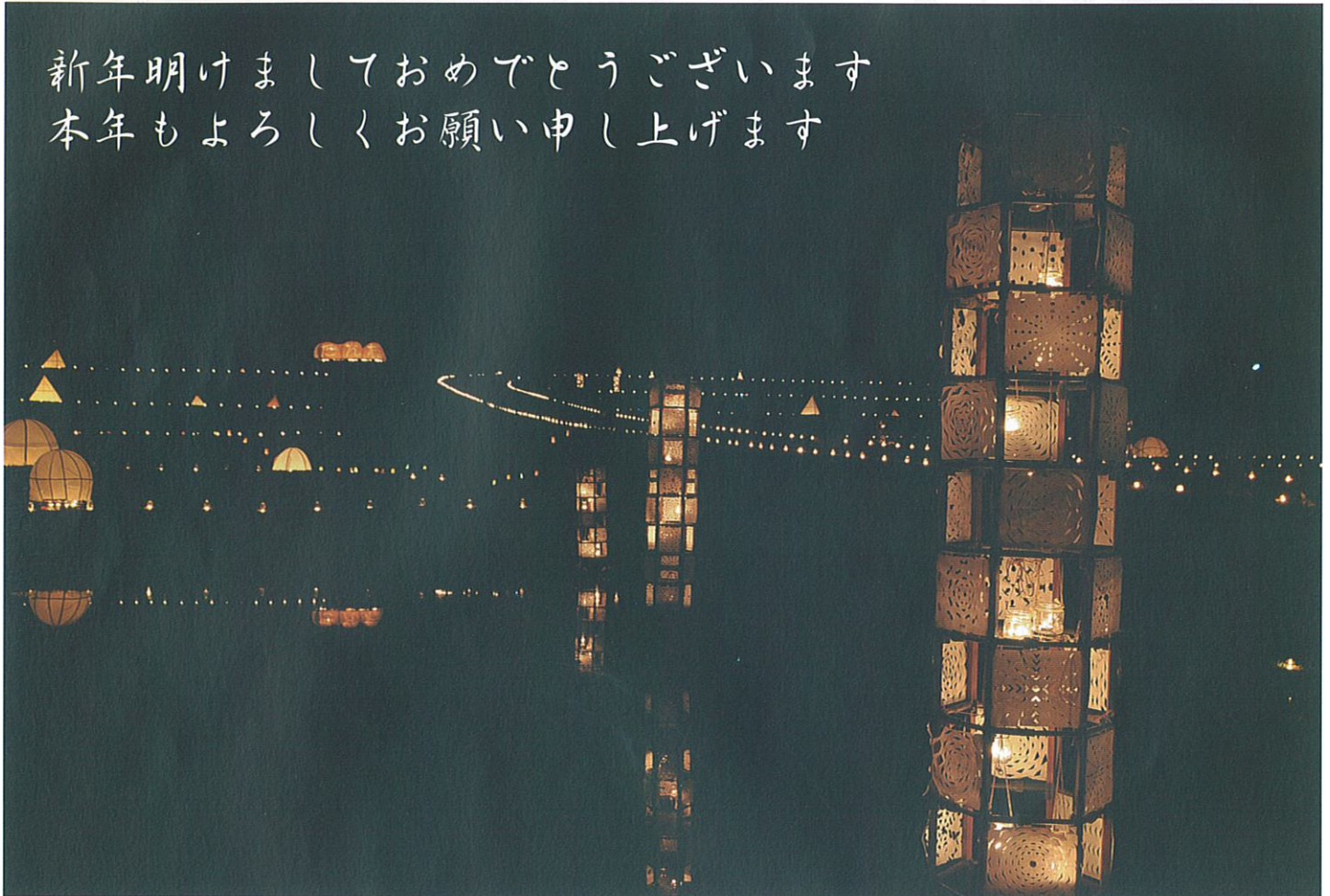
たんねのあかり(10月16日開催)