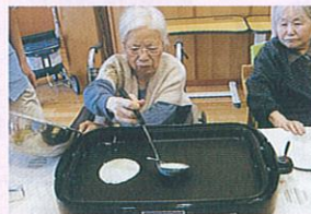
〈ホットケーキ作り〉 沢山作りま〜す。