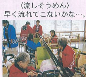
〈流しそうめん〉 早く流れてこないかな…。

季節や風情を感じていただけるように、お花見、えんま市、紅葉見物に外出しました。また、夏は流しそうめん、花火も行いました。流しそうめんは用意したそうめんがあつという間なくなるほど、みなさん沢山召し上がりました。