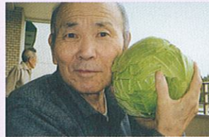
大きなキャベツとスイカが実りました。