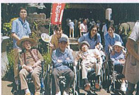
〈えんま市〉 えんま堂の前で記念撮影。