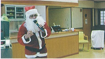
サンタさんの登場！

12月にクリスマスパーティーを行い、歌って踊れる♪サンタが登場しました。行事は毎月行うようにしており、利用者のみなさんには、大変好評で楽しんでいただいているようです。今後も何ががあるか、お楽しみに！