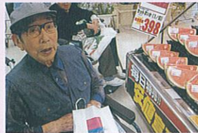
お店でおいしい物を買い物中です。

天候の良いときは園外へ行って季節を感じていただきました。野菜作りにも挑戦し、出来た野菜はなかなかの出来栄でした。日々の生活の中では、手芸や塗り絵をしてゆったり過ごしていただいています。