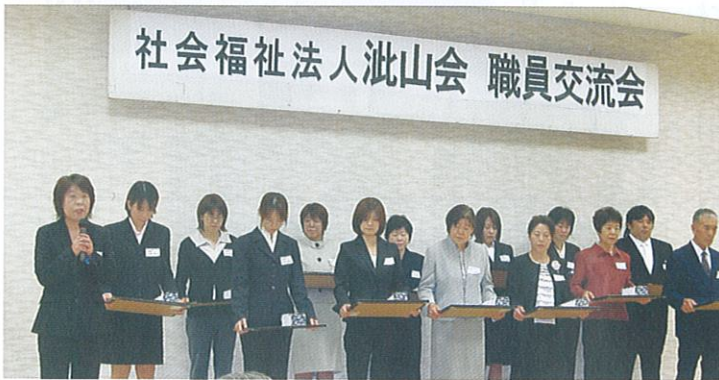
10年勤続表彰を受けた職員

「このたびは表彰いただきありがとうございます。これからも日々頑張っていきたいと思えます。」と