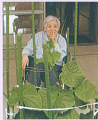
きゅうりが沢山採れました。