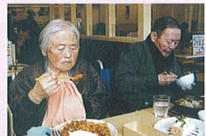
〈外食ツアー〉 どれもおいしそう!!

ホットケーキや焼きそばを入居者のみなさんと一緒に作り、目の前で調理し、おいしくいただきました。外食ツアーに出掛け、初めて“ガスト”へ行き、沢山のメニューの中から好きな物を選びました。