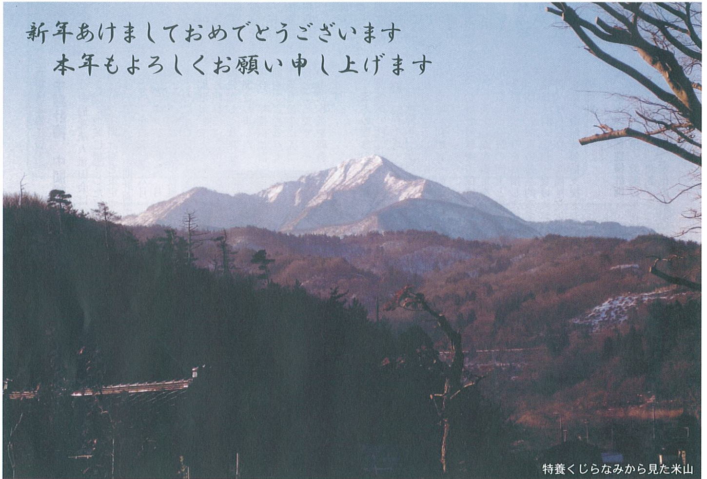
特養くじらなみから見た米山