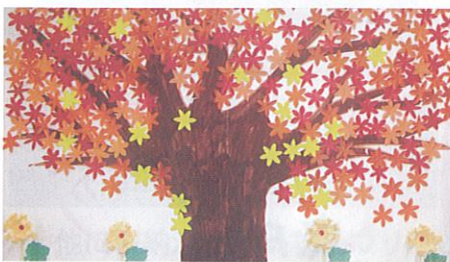
入居者作品 はり絵