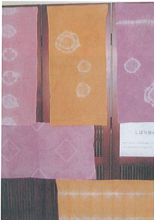
入居者作品 のれん(しぼり染め)