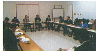
中間報告した理事会・評議員会 (12/4)

社会福祉法人汎山会は、五年後をめざし、地域に根ざした経営を展開するための中期計画を策定するため、幹部職員からなる「中期計画策定委員会（七名）」を設置し、六月一日から作業がスタートしました。月二回ペースで検討し、十月二日の役員会に報告するとともに、意見を聞き、また十二月四日には、再度報告し、意見をお聞きしました。現在、年度内に計画をまとめるべく作業も後半に入ったところです。その中間作業を報告します。