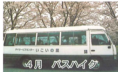
4月 バスハイダ 満開の桜を楽しんできました