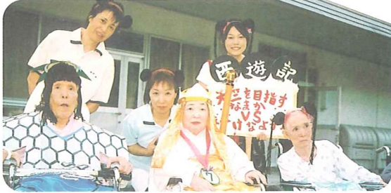
美しい三蔵法師といざ天竺へ!!