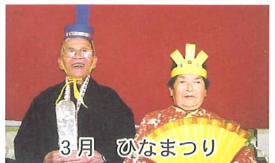
3月 ひなまつり 美男美女でお似合いです