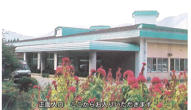
正面入口 ここからお入りいただきます