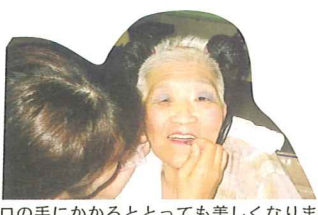
プロの手にかかるととっても美しくなります。