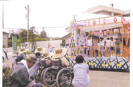
鯨波エコくじら見学