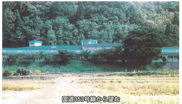
国道353号線から望む