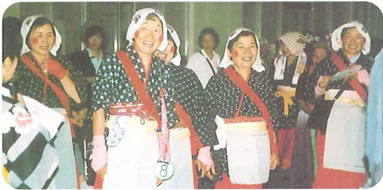
地域の方々もこんなにステキな衣装に変身して頂きました。ありがとうございました。