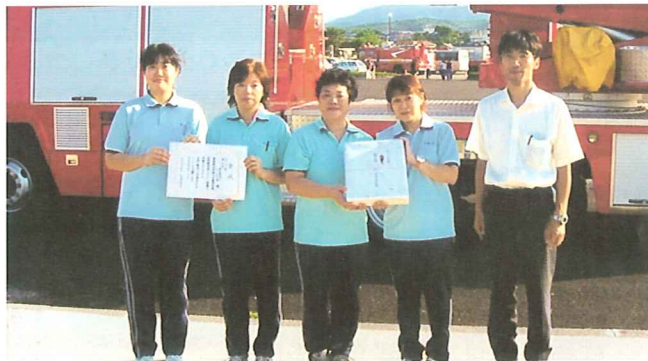
めでたく3位に入賞したいこいの里チーム