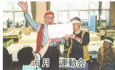
6月 運動会 優勝目指してハッスルハッスル