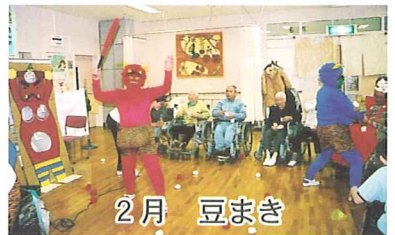
2月 豆まき 鬼は～外 福は～内