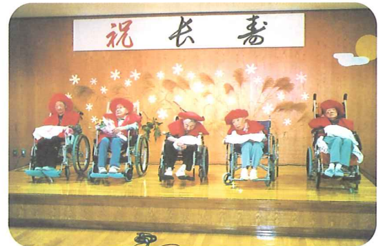
米寿を迎えられたご利用者

これからもご利用者の皆様が未永く、お元気に過ごしていただけるよう支援させていただきます。