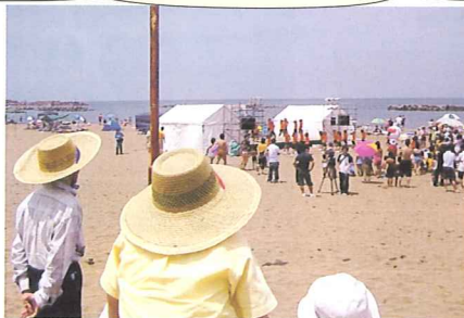
くじらなみ夏祭り