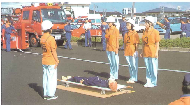
チームワークを発揮した柏柳の里チーム