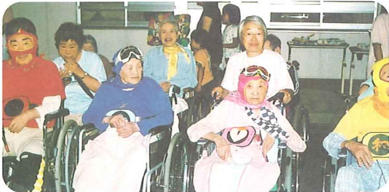
いこい戦隊5レンジャー参上!!

いこいの里では8月9日に“納涼仮装盆踊り大会”を行いました。毎年恒例の地域との交流行事になってはいますが、昨年は地震により中止となった為、2年ぶりの開催でした。今年も地域の皆様から大勢ご参加いただき、盛大に行うことができました。ボランティアの方々にもたくさん来ていただきました。地域の皆様、ご協力ありがとうございました。