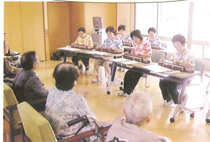
はまなす会 (大正琴)