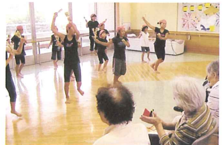
げいたつしゃ 鯨達者 (よさこい)