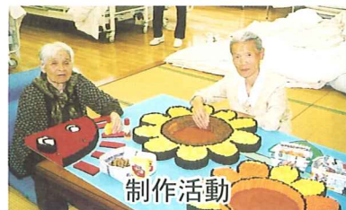
制作活動 素敵なヒマワリができましたよ