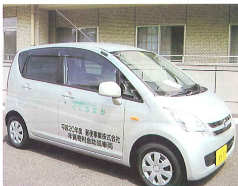
年賀寄附金配分事業の助成車輛

助手席のフロントシートが電動昇降式シートとなっております。高齢者や車椅子利用者の乗車がより容易に行うことができます。住宅地等の細い道でも小回りがきき、送迎車輛として活用させていただいております。