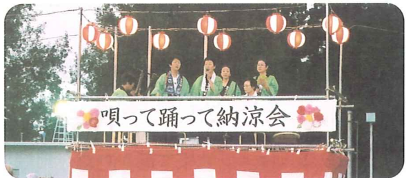
いつもご協力をいただいているみずほ会さま