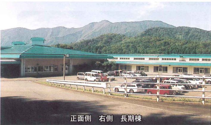
正面側 右側 長期棟