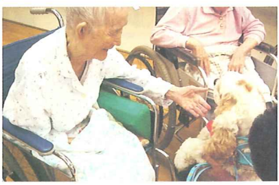
動物はとても癒されますね。