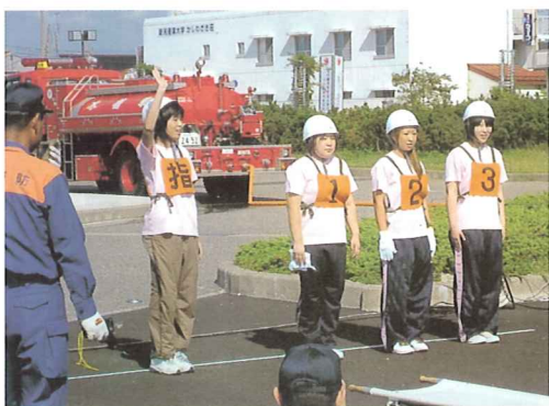
初出場 元気はつらつのくじらなみチーム

他に参加された他の事業所の真剣に取り組む姿勢を目の当たりにし、また実際に自分たちも練習や研究会を通じ、一人ひとりが防災に対する意識をしっかりと持つことで、利用者の皆様が安全で安心できる生活環境づくりができるよう、全職員あげて取り組んでいきたいと思っています。