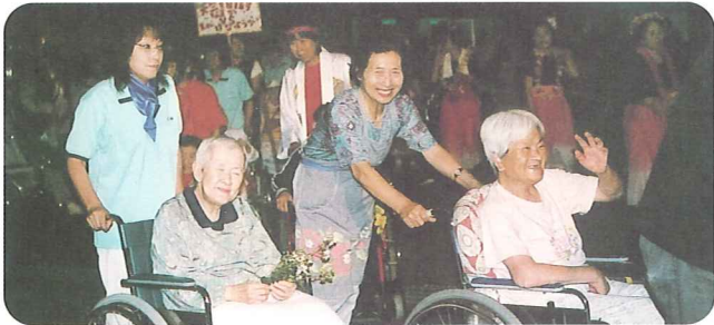
明るい笑顔のご利用者

今年の納涼会ではアルソアねむの樹サロン悠遊さんよりステキなメイクをしてもらいました。皆さん昔を思い出したのか自然と笑顔がこぼれていました。